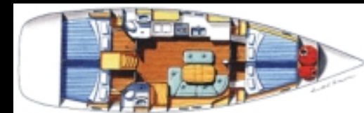
Oceanis 473 Clipper