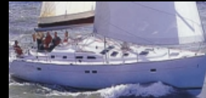
Nicht unseres, aber doch schon so